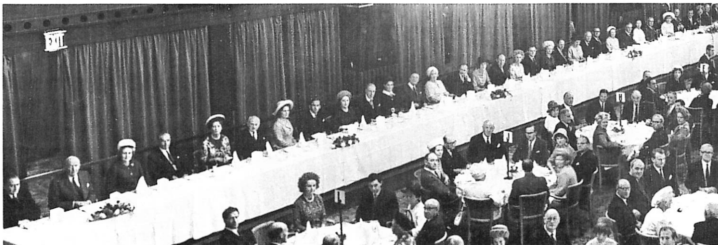
Annual Luncheon: View of part of the Top Table which does not appear in the picture overleaf.

In conclusion, Mr. President and Mr. Chairman, I would like to thank you again for inviting me to this most enjoyable luncheon and to say I look forward with much pleasure to my forthcoming visit to your country.